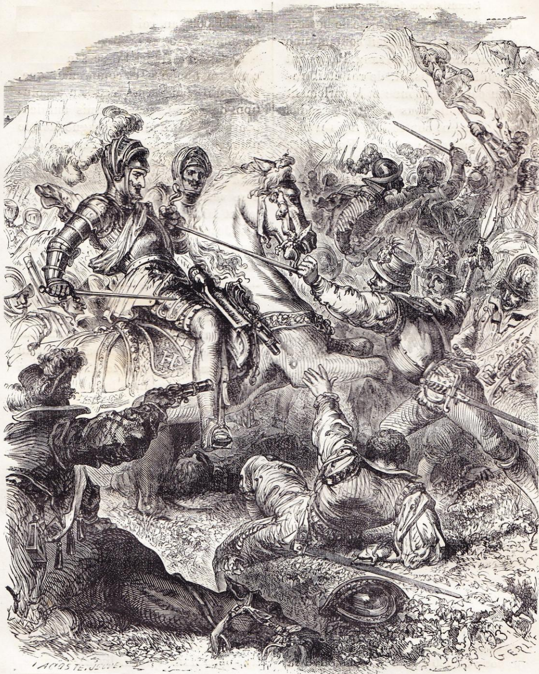
Henri IV au combat d'Aumale (mars 1592).