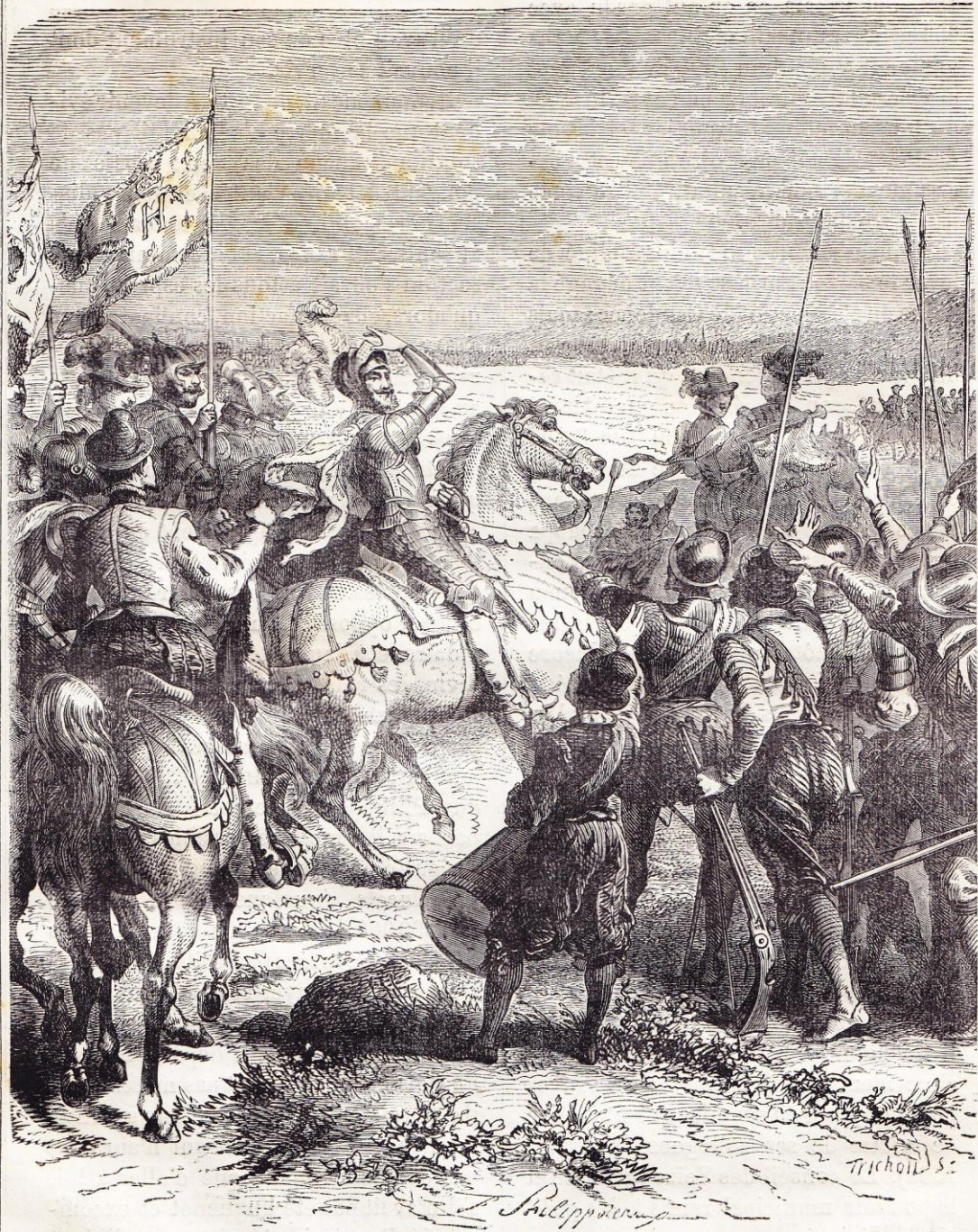
Bataille d'Ivry (15 mars 1590).

7 000 hommes de cavalerie, mais cette fois pour ne pas commettre la même faute qu'autour de Paris, en laissant